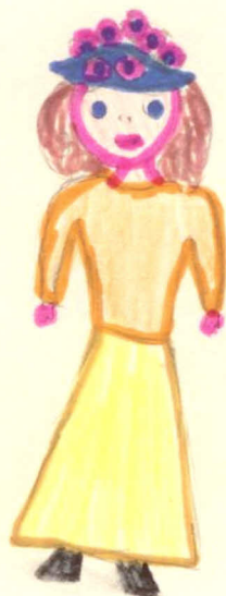
Tetička z Ameriky