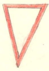
dej přednost v jízdě